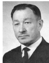
Antanas Maceina (1908-1987)

Kas pagrindžia Maceinos mintį, kad dvasios ateizmas yra pavojingesnis nei psichologinis?