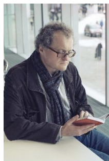
Leonidas Donskis (1962-2016)

3.3. Parašykite 150-180 žodžių samprotaujamojo rašinio pastraipą, kurioje samprotautumėte, ar žmogus, turėdamas laisvę rinktis, yra atsakingas už savo pasirinkimą. Fausto ir Mefistofelio sutartį įvertinkite krikščionybės ar Apšvietos kontekste. Savo mintis susiekite su spektaklio „Faustas“ aptartu epizodu (pavartokite lyginimo ar priešinio, įsitikinimo rodymo siejamuosius žodžius). Literatūrinę situaciją palyginkite su vienu iš pasiūlytų ar savarankiškai pasirinktu kultūriniu faktu: