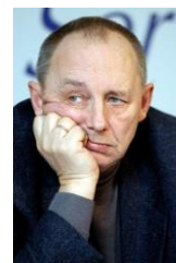
Arvydas Šliogeris (1944-2019)

Kaip suvokti savo ribas? O gal savęs stabdyti nereikia, kad gyvenime kažko pasiektumei? Kokių asmenybės bruožų pareikalauja iš žmogaus laisvė?