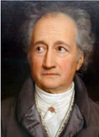
Juozapas Karlas Stieler (1828)